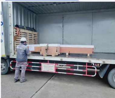
การตรวจสอบสภาพสินค้า