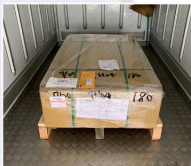
การจัดเรียงสินค้า