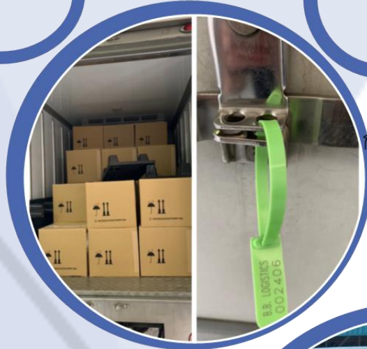
การตรวจสอบเบอร์ซีล