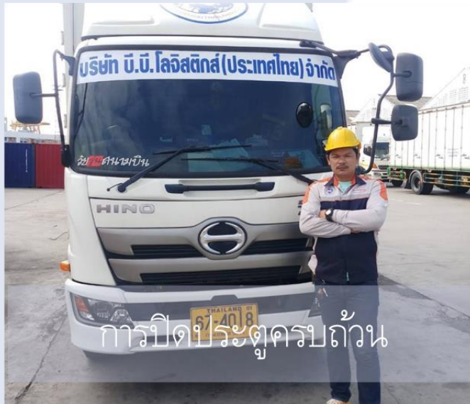
การปิดประตูครบถ้วน

8. หากเกิดเหตุฉุกเฉินหรืออุบัติเหตุระหว่างการขนส่งพนักงานขับรถบรรทุก จะต้องรายงานปัญหาให้ทางบริษัทรับทราบทันที โดยรายงานมาที่หัวหน้าขนส่งเพื่อรายงานปัญหาให้ผู้เกี่ยวข้องและลูกค้าทราบต่อไป