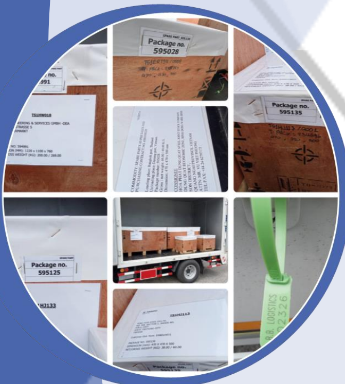
การตรวจสอบสินค้าก่อนเดินทาง