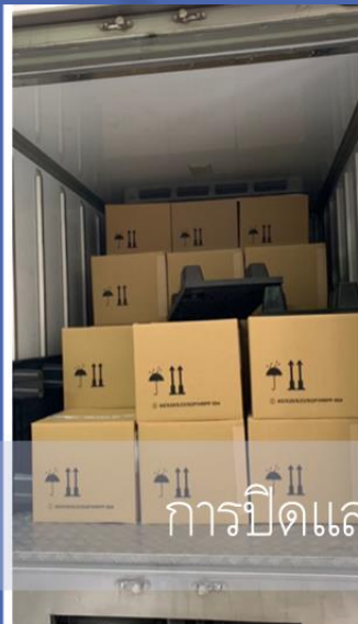
การปิดและล็อกซีล

7. พนักงานขับรถบรรทุกต้องปิดประตูพร้อมล็อกกุญแจหรือซีล ครบทุกประตูให้เรียบร้อยก่อนเคลื่อนรถออกจากพื้นที่