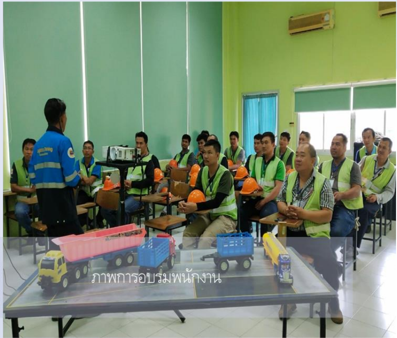
ภาพการอบรมพนักงาน

BUMRUNGPAL บริษัท บำรุงพลขนส่ง จำกัด TRANSP R7