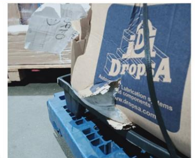
กล่องฉีกขาด แจ้งชิปปิ้ง ดำเนินการ