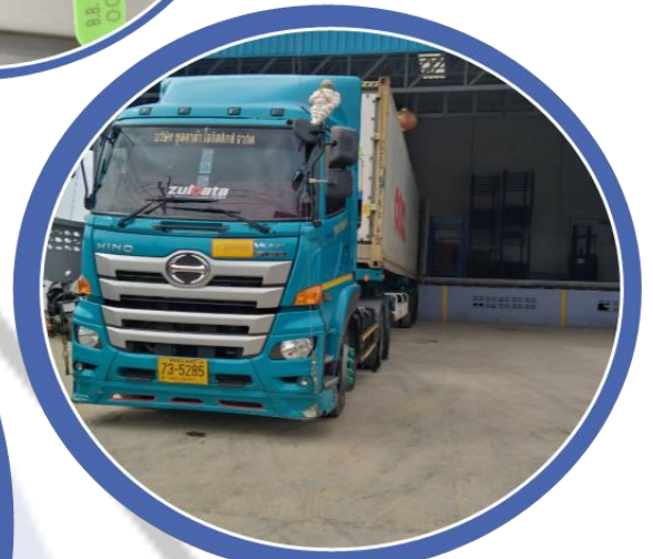
การบรรจุสินค้า